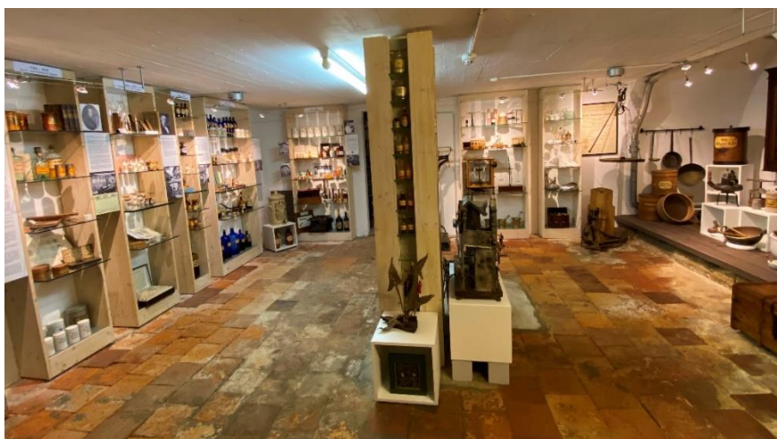
Bern 2021