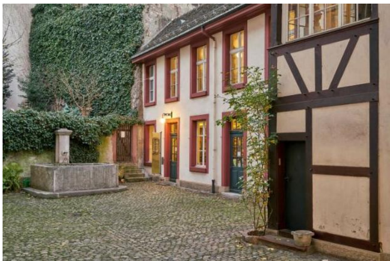
Abbildung 3: Romantischer Hof des Pharmaziemuseums

18.10.2025 eine internationale Tagung stattfinden. Thema: «Wie das Sammeln alter Dinge die Pharmazie modernisierte». Details folgen.