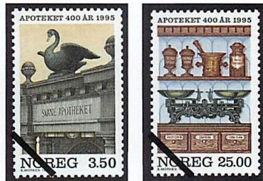
Abbildung 6: Norwegische Marken (Quellen: Löwen-Zahn, Band 56, Heft 20, S.1-5)

(Quelle: DRS2, Musik für einen Gast, 1.Sept. 2024)