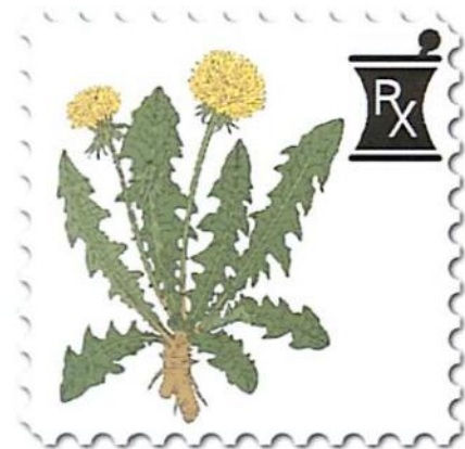
Abbildung 5: Logo des Mitteilungsblatt Pharmazie und Philatelie "Löwen-Zahn"

Seit etlichen Jahren ist sie zuständig für Tests, Blutuntersuchungen, EKG, Koordination von Massnahmen; sie organisiert Herzklappen und ist erste Kontaktstelle für Anfragen. Zudem managt und betreut sie anspruchsvolle Studien, darunter eine 10-jährige Langzeitstudie.