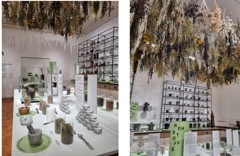
Abbildung 8: Einblick in die Mörser-Ausstellung

https://pharmaziemuseum.ch/de/besuch/aktuell/offentliche-fuehrungen