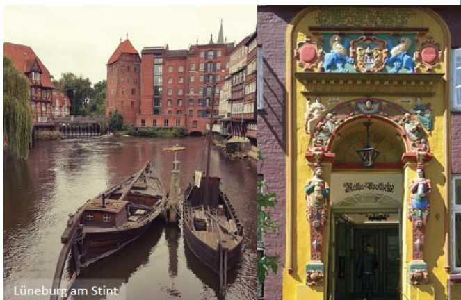
Lüneburg am Stint