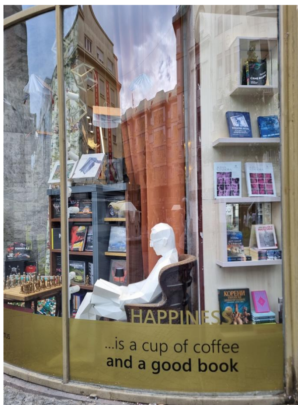
Abbildung 1: Großartige Buchhandlungen, auch mit fremdsprachigen Büchern

Nach dem feinen Mittagessen führte uns der Spaziergang an der Sonne durch Porrentruy an einen verwunschenen, spannenden Ort, welchen niemand gekannt hatte: den Botanischen Garten JURASSICA. 1833 wurde dieser vom Geologen und Botaniker Jule Thurmann als zweiter solcher in der Schweiz gegründet. Der erste botanische Garten war im Jahr 1589 in Basel von Caspar Bauhin angelegt worden. Porrentruy erhielt aus verschiedenen privaten Schenkungen eine grosse Sammlung von Pflanzenarten (Sukkulente, Orchideen, fleischfressende Pflanzen, etc.) welche den Jesuitenpark, die Gewächshäuser und den Museumspark bereichern.