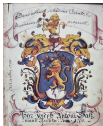
Abbildung 4: Fotos von UH

Wenige Jahre später wurde die Apotheke an die Familie Dürholz verkauft und Gassmann aus seinem Vertrag frühzeitig entlassen. 1803 kaufte Anton Pfluger, die nun umbenannte Schlangen-Apotheke. Nach Pfluger folgen die Pfaehlers, dann die Dikenmanns, welche die Apotheke 1966 an die Gurzelngasse zügelten. Liquidation 2012.