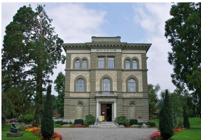
Abbildung 2: Museum Zofingen

In Abtausch mit der Generalversammlung im Herbst 2025, findet der diesjährige gesellige Anlass bereits im Frühling statt. Wir besuchen das historische Städtchen Zofingen, in welchem pharmaziegeschichtlich einiges zu erfahren ist: z.B. von der historischen Löwen-Apotheke der Familie Fischer oder von der uns allen bekannten Siegfried AG, welche schon im ausgehenden 19. Jh. industriell galenische Präparate herstellte und heute eine der wenigen Firmen in der Schweiz ist,