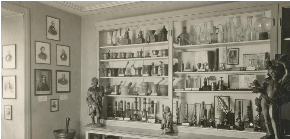
Abbildung 9: Pharmaziemuseum aus alten Zeiten

Das Pharmaziemuseum wird 100 Jahre alt. Das soll gefeiert werden. Während der Jubiläumsmonate lädt das Museum herzlich dazu ein, neue Facetten des Museums kennenzulernen: mit Depotführungen, Workshops zum Selberanpacken und vielem mehr. Das weitere Programm wird im Laufe des Jahres bekannt gegeben. Das Museum freut sich, Sie auch in diesem Jubiläumsjahr zahlreich begrüssen zu dürfen.